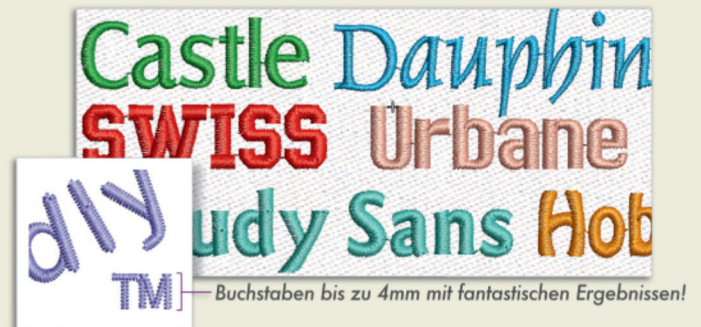
Buchstaben bis zu 4mm mit fantastischen Ergebnissen!